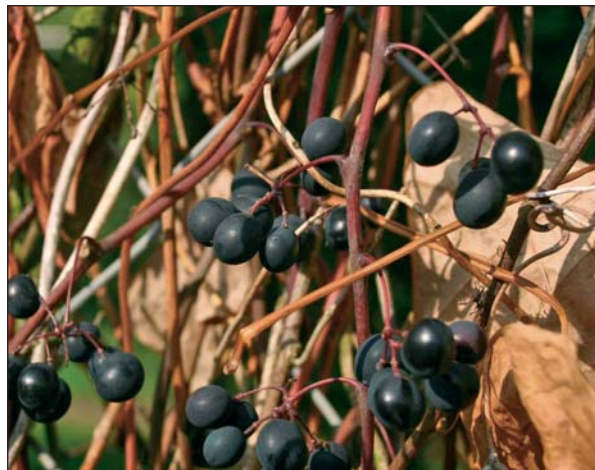
Vitis labrusca