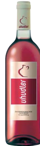
A nakonec jedna „liščí“ krajová specialita: Uhudler – stolní víno z jižního Burgenlandu