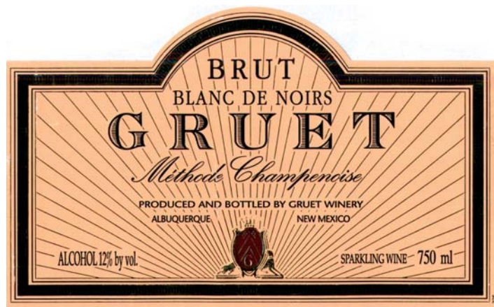
Blanc de Noirs z Nového Mexika