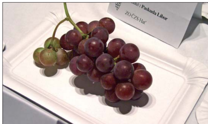
Vitis labrusca na výstavě hroznů Slezska ve Velkých Hořticích