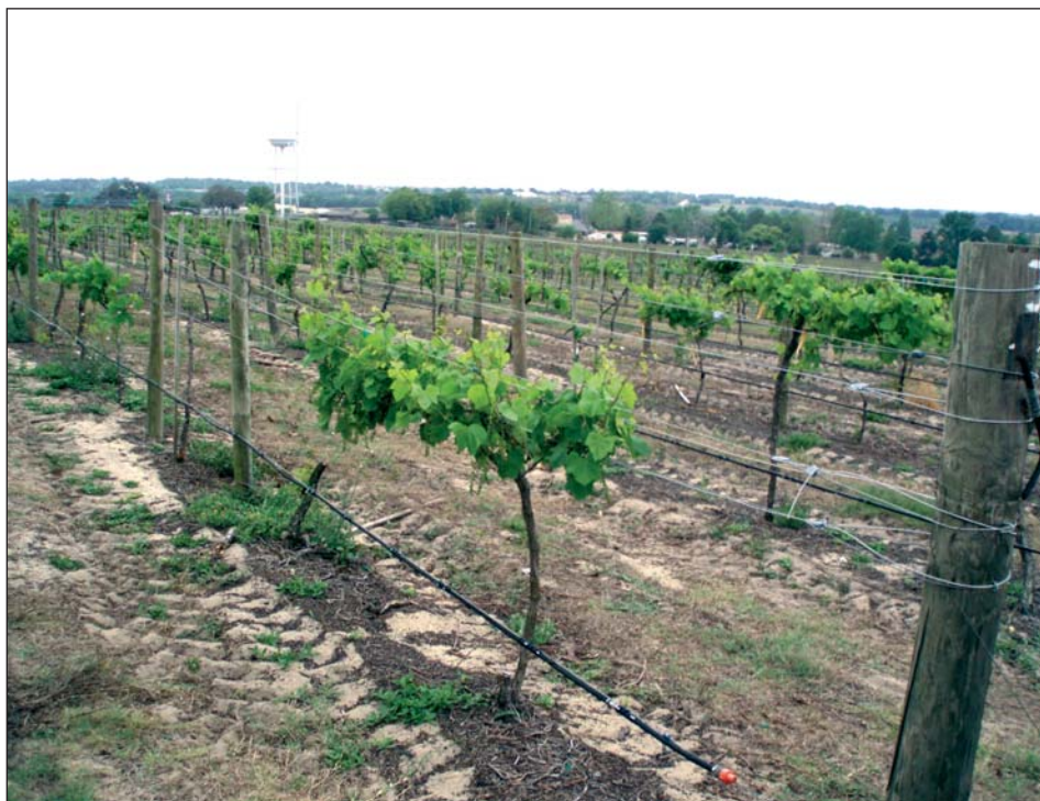
Florida hybrid bunch grapes (Clermont, Florida)

réva). Otcovská odrůda, Cardinal , je raný kalifornský stolní kultivar: Flame Tokay x Alphonse Lavallée (Alphonse Lavallée je mj. využívan k produkci rosé vín na ostrově Bali).