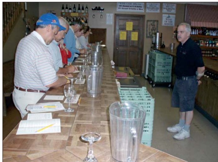
Degustací vín vrcholí prohlídka vinařství Lakeridge Winery

tá slupka, štěpování na podnože nutné, využití: pick-your-own, stolní hrozen, bílé víno), Suwannee (světle zelená slupka, štěpování na podnože nutné, využití: pick-your-own, mošt, vinné želé, bílé víno muškátového typu), Blue Lake (raná odrůda, fialová slupka, využití: mošt, vinné želé), Daytona (červená slupka, využití: stolní hrozen), Black Spanish (fialová slupka, štěpování na podnože nutné, využití: červené víno stolní kategorie), Blanc du Bois (světle zelená slupka, nevyžaduje štěpování, využití: bílé víno jakostní kategorie), Lake Emerald (raná odrůda, světle zelená slupka, využití: mošt, vinné želé, bílé víno), Orlando Seedless (bezsemenná stolní odrůda, štěpování na podnože nutné).