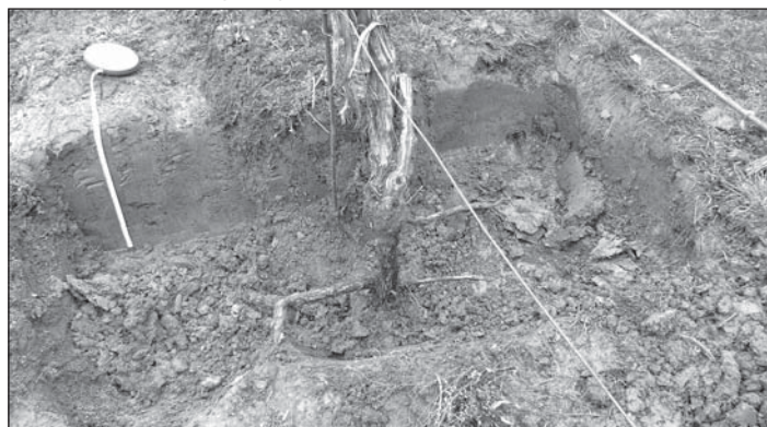
Obrázek 4 – Kořenový systém 25letého keře

Při hodnocení kvality terroir a kvality vína jsou proto rozhodující všechny významné geologické a půdní vlastnosti.