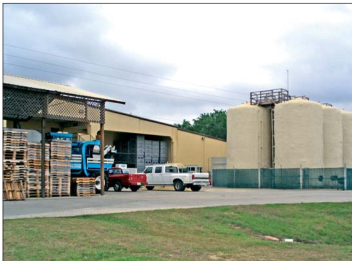
Největší vinařství Floridy (Lakeridge Winery)