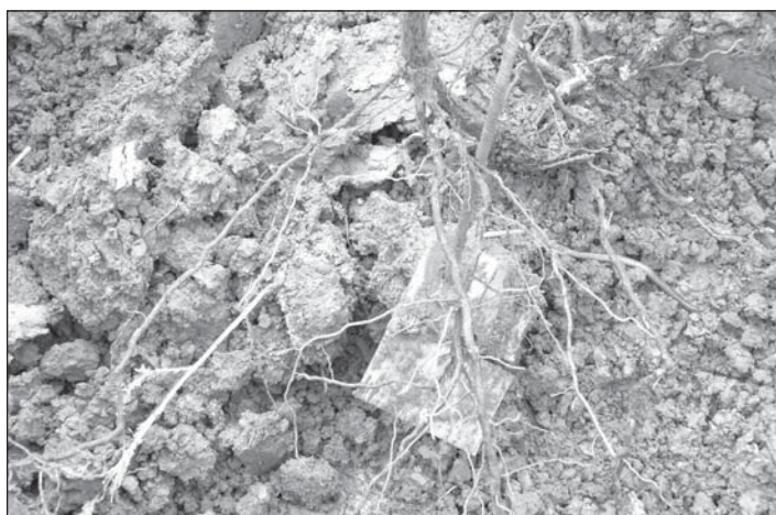
Obrázek 2 – Hlavní kořeny

Ve kvalitě terroir sehrává struktura půdy velmi významnou úlohu. Nejlepší terroir jsou charakteristická vysokým stupněm pórovitosti dovolující rychlé pronikání vody, čímž pozitivně působí na rozvoj kořenového systému. Pórovitost půdy má v tomto směru velký význam. V půdě by měl být vyrovnaný poměr obou druhů kořenů, neboť jeden druh slouží pro výživu a druhý zabezpečuje révě vodu a především „chuť terroir“.