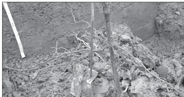
Obrázek 3 – Vedlejší kořeny zabezpečují příjem živin

SEGUIN (1986) v souvislosti se vztahem půdy a terroir uvádí, že pouze aktivní uhlíčan vápenatý je všeobecně spojený s kvalitou vína. Mnoho kvalitních vinic se nachází na vápenatých půdách. Vápník má velmi významný vliv na zlepšování strukturálních vlastností půdy. Naopak nepřítelem kvality vína a dobrého terroir je půda přehnojená dusíkem.