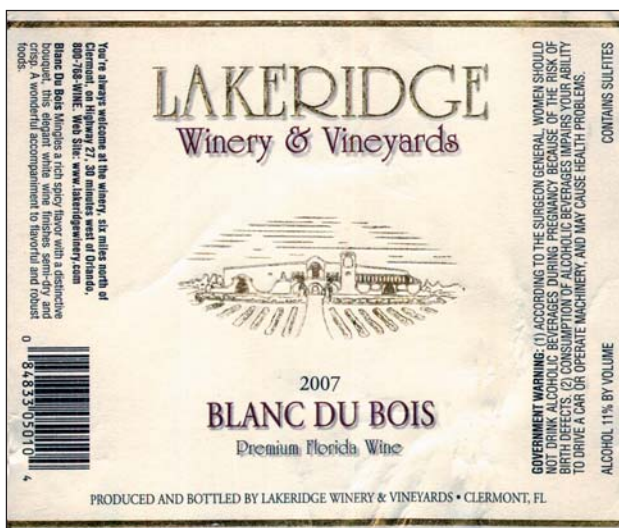
Blanc du Bois

Lakeridge Blanc du Bois 2007 – světle žlutá barva, jemná muškátová vůně, středně plné, svěží, dlouze dozrívající s tóny citrusových plodů a vanilky (**½)