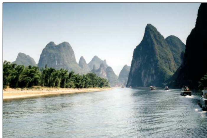
Řeku Li lemují bizarní vápencové útvary