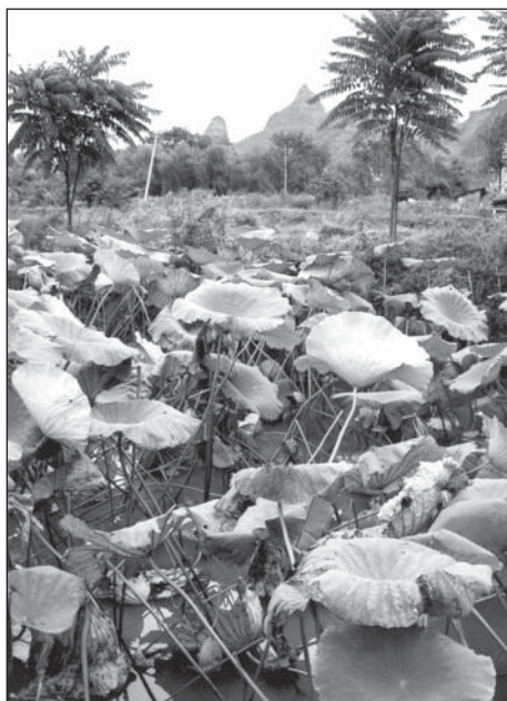
Lotosové pole ve „Vesnici broskvového květu“

Rozvoj nastal, soudě dle čínského tisku, teprve se vznikem Čínské lidové republiky: „Tři etapy budování vinařského průmyslu – obnova, výstavba, otevření světu – vedly čínské vinaře k dnešním velkolepým výsledkům.“ Tolik oficiální verze. Během prvé pětiletky byl zahájen provoz vinařského závodu v Pekingu, následovala vinařství Tsingtao , Tonghua , Danfeng , Shacheng a další. Za druhé pětiletky bylo vybudováno několik desítek vinařských závodů v provinciích podél toku Žluté řeky – Čenan, An-chuej a Ťiang-su. Přestože důraz byl kladen na výsadbu odrůd dovezených z Bulharska, Maďarska a SSSR, zachovány byly i některé tradiční čínské odrůdy. V roce 1949 vyprodukovala Čína sotva 200 tun hroznů. V letech sedmdesátých již činila celková produkce 60 000 tun a pracovala zde stovka vinařských závodů. Nová moderní vinařství měla přitom teprve vzniknout. A to nejen v tradičních vinařských oblastech, ale i v nově vytipovaných regionech, např. v oblasti Liaotungského a Pochajského zálivu. Sklizeň roku 1981 poprvé dosáhla mety 100 000 tun a za dalších 7 let byla úroda ještě třikrát vyšší. Na úspěchu se významnou měrou podílela joint ventures , využívající jak zahraniční kapitál, tak i dlouholeté vinohradnické a vinařské zkušenosti partnerů z vyspělých vinařských zemí.