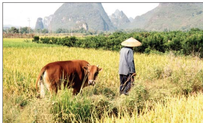
Na rýžových polích pomáhají rolníkům buvoli