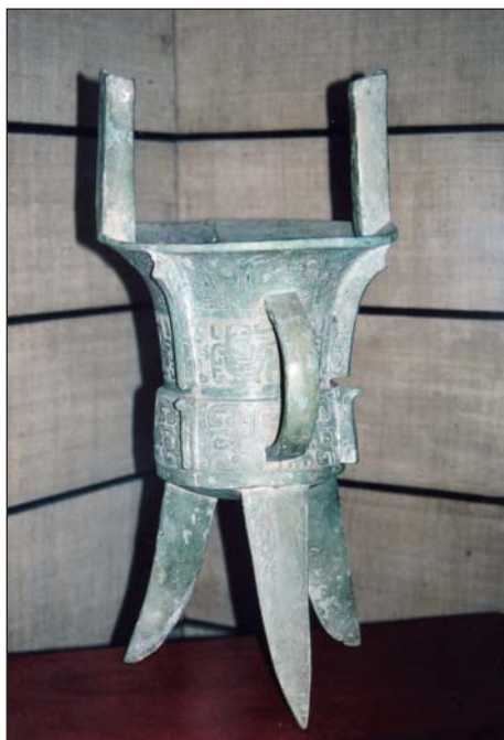
Trojnohé poháry slouží k ohřevu vína